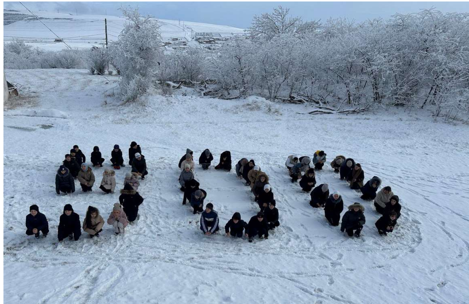
Флешмоб «900 дней подвига»