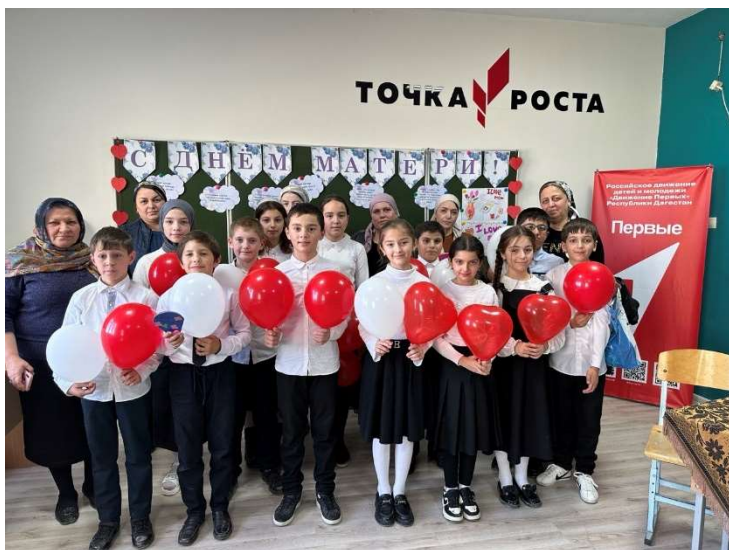
Ценность – Уважение. 25.11.2023г. День матери.